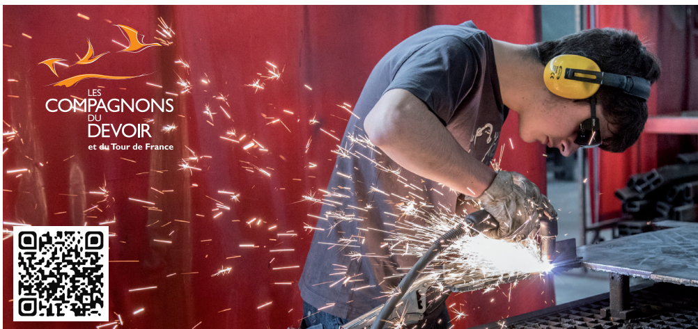
© 2019 Compagnons du Devoir - Crédits photos : Thierry Caron / Divergence - Ne pas jeter sur la voie publique.

Le serrurier-métallier réalise des ouvrages très variés, qui peuvent relever de domaines aussi bien artistiques qu'industriels. Il/elle couvre de nombreuses activités qui s'articulent toutes autour du travail des métaux : la construction métallique, la menuiserie métallique, la menuiserie aluminium verre, la serrurerie, le bâtiment, la ferronnerie, la décoration, le traitement des surfaces et la pose.