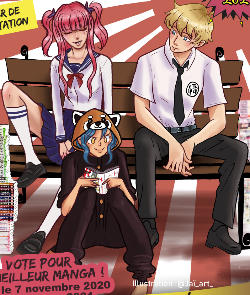
Illustration : @Jai_art_

VOTE POUR LE MEILLEUR MANGA ! entre le 7 novembre 2020 et le 27 mars 2021